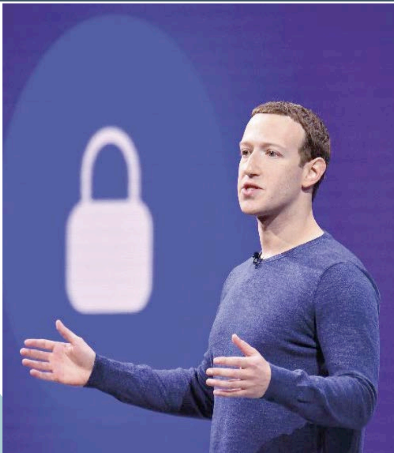
Mark Zuckerberg, fondatore e principale azionista di Facebook, il gigante della Silicon Valley il cui ultimo progetto è la creazione della moneta virtuale Libra

«L'architettura neoliberale rifiuta qualunque modello di coordinamento sociale che non sia quello del mercato, perché non vi vede altro che il Leviatano dello Stato che invade la libera concorrenza inquinandola con valori come solidarietà e collaborazione. Il suo vero bersaglio è lo Stato perché l'unico sovrano che può controllare o distruggere i mercati. Da qui l'alleanza con la cosiddetta "società civile" - siano gang criminali o Ong - pur di sottrarle al "totalitario" controllo statale. Quanto alla proprietà privata, l'ironia è che è proprio la corrente neoliberale a metterla in discussione nel suo tentativo di mitigare in senso distributivo le iniquità aberranti del sistema attraverso il market design, la progettazione digitale di nuovi mercati. Ad esempio con libri come "Radical Markets", il recente saggio di Glen Weyl ed Eric Posner, che considera la proprietà privata come l'anticamera del monopolio, a sua volta dannoso per il