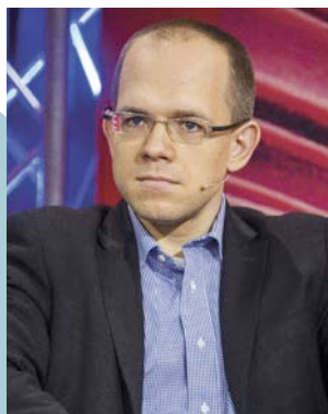
Evgeny Morozov, 35 anni, sociologo bielorusso, è considerato uno dei massimi esperti al mondo di nuovi media. È uno dei più ascoltati critici del cyber-ottimismo

La volontà di dominio si è estesa con Libra, la moneta di Facebook. «Un altro passo verso la delega alle aziende tecnologiche di quelle che erano importanti funzioni dello Stato»